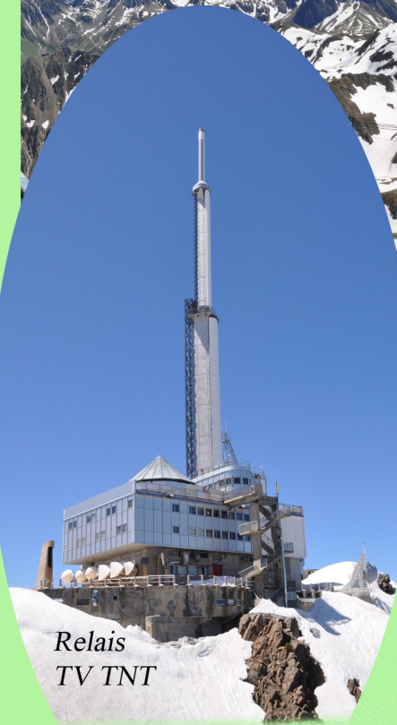
Relais TV TNT

Situé à 246 Km de Chalets les Templiers. L'histoire scientifique du Pic, avant d'être astronomique, fut Météorologique. la première station météorologique est achevée le 21 août 1873 au col de Sencours. De 1874 à 1984 la station d'observation météorologique située dans la tour métallique sur la terrasse Nord a fonctionné sans interruption avec la présence d'un technicien. La station effectue des relevés de température, de pression atmosphérique, d'hydrométrie, de pluviométrie, de hauteur de neige, de mesure de l'ozone, de radioactivité et d'étude des nuages. Depuis 1984, La station est automatique. Quelques chiffres issus de ces relevés :